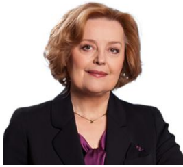
Magdaléna Vášáryová (slovenská politička a diplomatka)